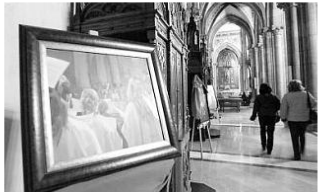
Arte a la venta para sufragar el coste del órgano miki lópez

Seis cuadros de Favila se exhiben durante los conciertos de la Semana de música religiosa con la finalidad de encontrar compradores para los mismos. Parte del dinero que se obtenga se destinará a la Fundación Avilés Conquista Musical, entidad que recauda fondos para pagar el nuevo órgano de Sabugo. En la imagen, algunos de los cuadros.